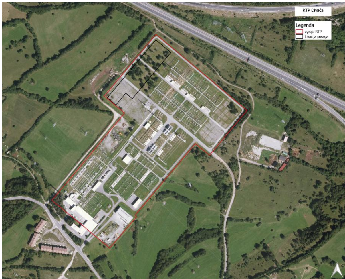
Shema lokacije posega znotraj RTP Divača

Ocenjujemo, da se bo poseg izvajal na površini cca. cca. 0,81 ha znotraj ograje RTP, ki obsega 10,50 ha.